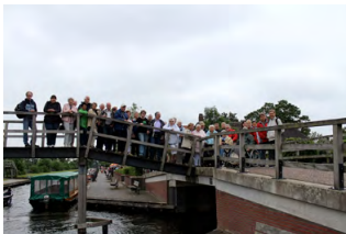
Ausflug 2015 Giethoorn (NL)

Den Abschluss des Vereinsjahres bildet traditionsgemäß unsere Adventsfeier am ersten Advent