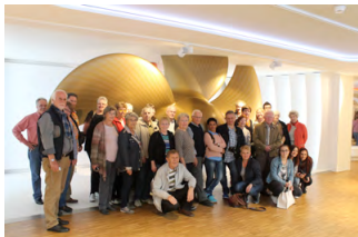
Ausflug 2016 Papenburg

Weiterhin begeben wir uns einmal pro Jahr auf einen Ausflug in die nähere und weitere Umgebung.